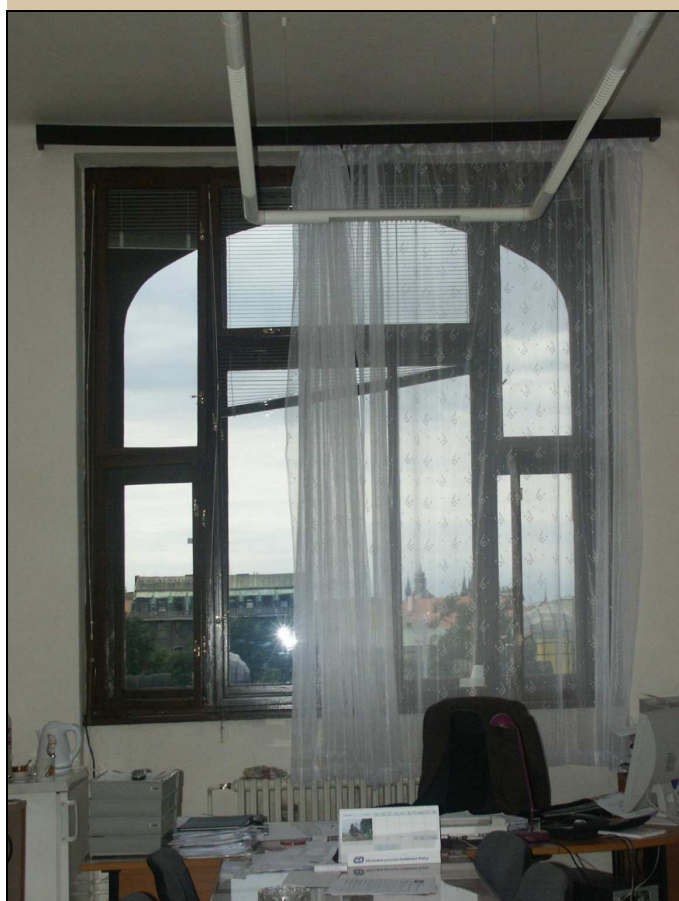
okno – celkový pohled z interiéru